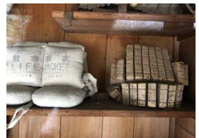
琴平宮参道にあった昔の救命胴衣

省令改正により赤字表記の2項目を違反点数対象に追加（平成28年7月1日施行） 「救命胴衣の着用義務違反」：平成30年2月1日から強化された事項（43頁参照） についての違反点の付与は平成34年2月1日開始